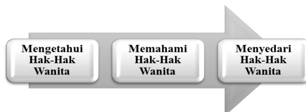
Rajah 1: Pemetaan Literatur Kajian 'Wanita Islam Dan Perceraian: Satu Kesedaran Dan Keperluan'

Berdasarkan penelitian pengkaji terhadap kajian-kajian lepas, kajian yang dilaksanakan ini merupakan nilai tambah dalam menekankan aspek pemahaman terhadap isu perceraian akan membawa kepada kesedaran berkaitan hak-hak wanita. Kajian tertumpu kepada tahap kesedaran wanita di Kota Bharu menurut peruntukan hak-hak mereka selepas bercerai di bawah enakmen Undang-undang Keluarga Islam No.6 Tahun 2002 Negeri Kelantan.