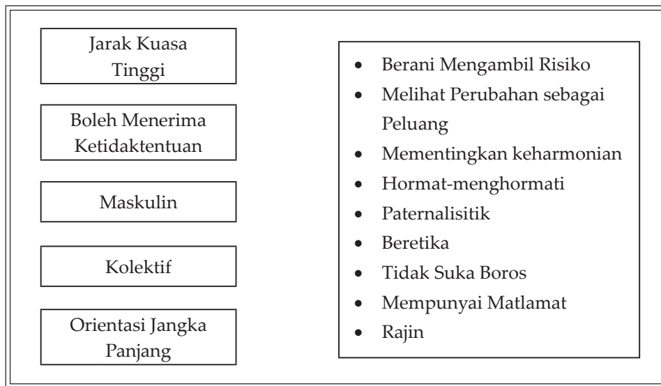
Gambar Rajah 2. Dimensi Nilai Hofstede dan Ciri-ciri Keusahawanan Cina