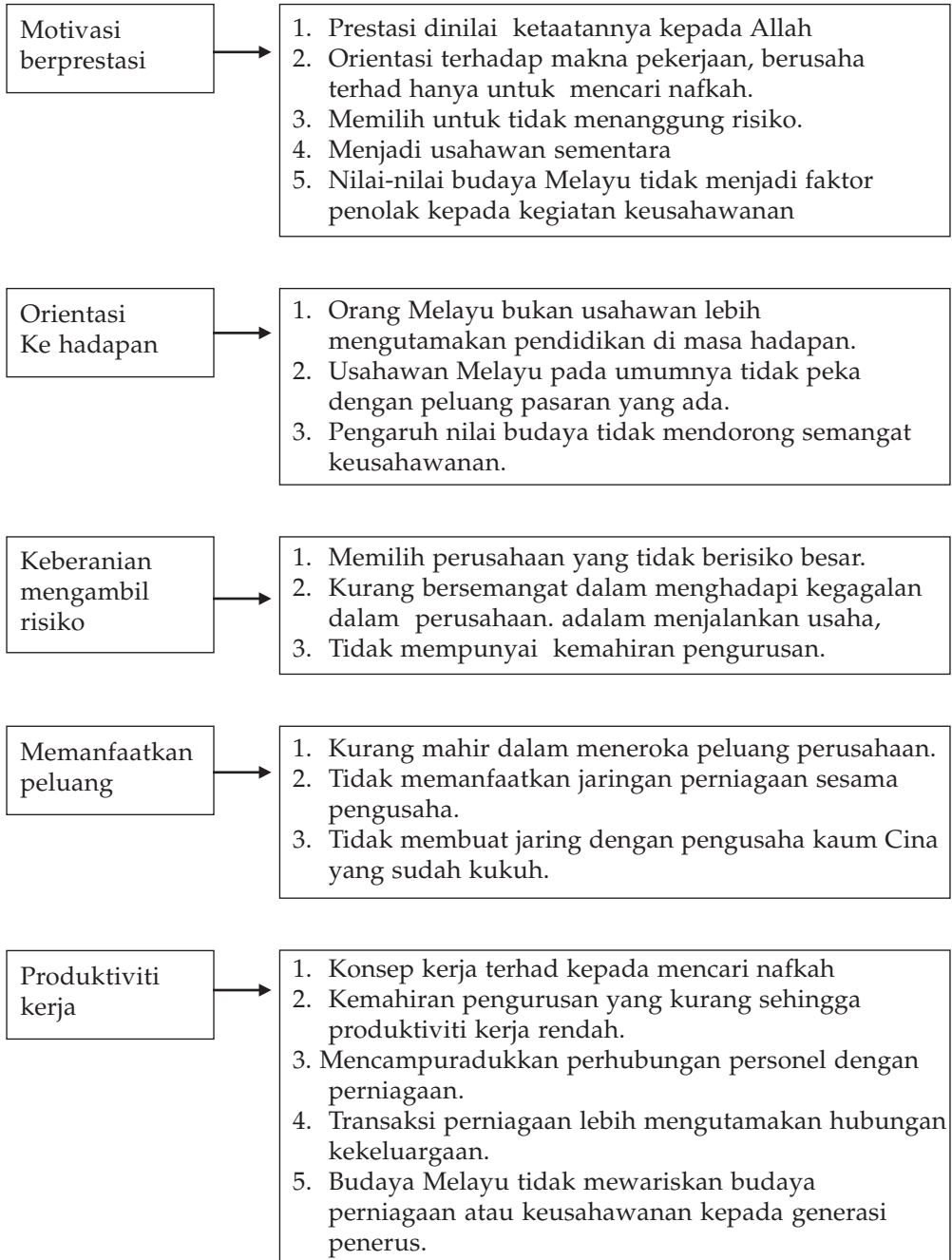
Rajah 2: Ciri-ciri Keusahawanan Melayu

Terdapat beberapa ciri keusahawanan di kalangan orang Melayu di Pontianak seperti yang dalam rajah dan huraianya.