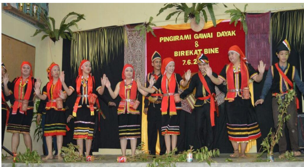
Gambar 3: Perubahan menggabungkan penari lelaki dan perempuan tarian Langgi Pingadap

Abdul Rahman Embong (1999) pula menjelaskan identiti adalah sesuatu yang dipunyai oleh setiap individu dan ia melibatkan cara bagaimana individu cuba untuk mengertikan dunia sekitarnya. Ia sebenarnya berkait rapat dengan identiti yang membentuk kepada identiti masyarakat kerana hidup bermasyarakat adalah ciri-ciri utama kewujudan manusia. Menurutny lagi, identiti yang ditunjukkan ini akan diterima menjadi identiti individu atau masyarakat setelah ia ditranslasikan oleh individu atau masyarakat itu. Ia juga merupakan interaksi dengan pelbagai sumber seperti sejarah, agama, geografi sosial, alam sekitar dan pelbagai lagi yang berhubung dan mempunyai pengaruh terhadap perilaku dan aktiviti manusia.