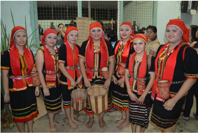
Gambar 1 : Busana pakaian tarian Langgi Pingadap

kombinasi warna utama iaitu putih, kuning dan merah. Pakaian lengkap bagi kaum wanita masyarakat Bidayuh ialah baju yang berlengan pendek atau separuh pendek. Bagi kaum lelaki masyarakat Bidayuh pula, mereka akan mengenakan sepasang persalinan berbentuk baju hitam separa lengan atau berlengan pendek dengan sedikit corak berunsur flora dan seluar hitam atau cawat yang berwarna asas seperti biru, merah dan putih. Perhiasan kepala juga dipakai iaitu kain merah yang dililit di atas kepala.