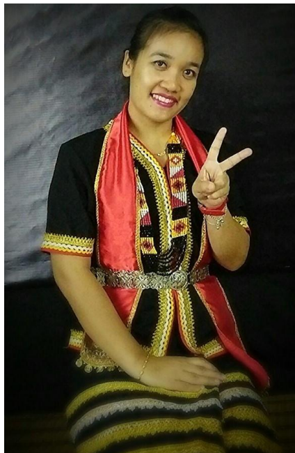
Gambar 2: Gadis Bidayuh mengayakan pakaian Langgie Pingadap

Kewujudan sesebuah identiti di dalam sesebuah masyarakat adalah untuk memastikan unsur keberadaan mereka mendiami sesebuah kawasan. Identiti adalah sebagai suatu 'tanda' pengenalan yang membezakan suatu dengan yang lain. Sebagai contoh nama yang diberikan kepada setiap manusia merupakan tanda identiti yang membezakannya dengan orang lain. Chris Weedon (2004) menjelaskan bahawa identiti adalah suatu yang dipunyai oleh individu sama ada dalam bentuk persamaan atau perbezaan dengan individu lain. Ia menjadi suatu pengenalan yang kukuh tentang suatu individu berkait rapat dengan sifat fizikal dan nilai.