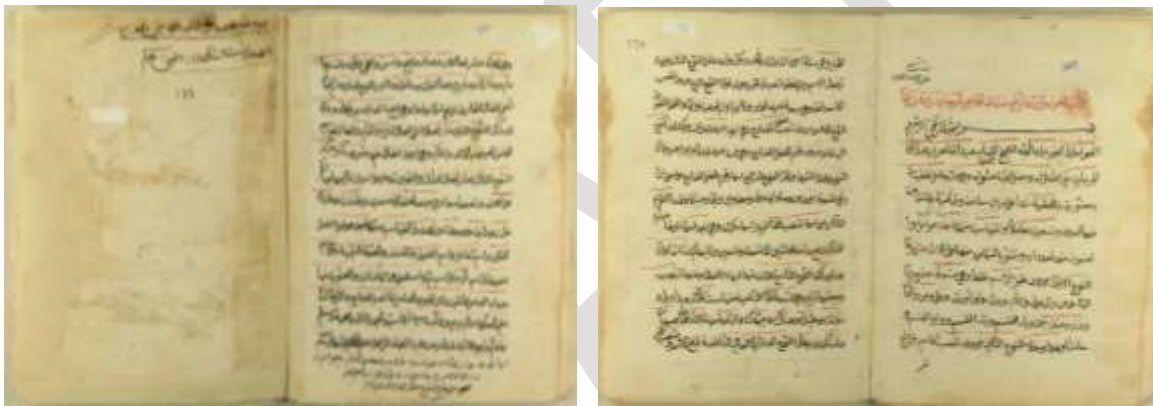
Rajah 1: Keseluruhan 3 halaman manuskrip al- ° Awamil al-Mi'ah yang bertarikh 1819 disimpan oleh Idarat al-Makhtutat wa al-Maktabah al-Islamiyyah , Kuwait.

Karya ringkas (kira-kira 3 halaman manuskrip) yang bertujuan mempermudah hafalan itu mengumpulkan 100 ° Amil yang paling kerap digunakan dalam bahasa Arab sebagai satu titik permulaan kepada pengajian ilmu Nahw bagi masyarakat bukan Arab. Ia paling banyak dikenali di benua bukan Arab seperti Iran, Eropah Tenggara, Transoxiana, Anatolia, Azerbaijan, dan Asia Tenggara. Tidak dinafikan karya al- ° Awamil al-Mi'ah turut digunakan di beberapa negara Arab seperti Yaman, Mekah dan Madinah namun faktornya mungkin kerana ramai pendatang bukan Arab juga tinggal di kawasan itu. Hadramaut merupakan wilayah perdagangan laut yang terkenal khususnya di Teluk Parsi dan Malabar (India Selatan) bermula abad ke 2 sebelum masihi lagi. (Jawad ° Ali 1993 Jil. 2: 135) Mekah dan Madinah pula menjadi pusat keagamaan orang Islam sejak berlakunya pembukaan kota Mekah pada tahun ke 8 hijrah/629 masihi. Setelah agama Islam tersebar ke wilayah ° Ajam sebelum pertengahan abad pertama hijrah/7 masihi, Mekah dan Madinah menjadi dua kota kosmopolitan yang sentiasa sibuk kerana menerima kunjungan berterusan umat Islam seluruh pelusuk dunia bagi mengerjakan haji dan umrah.