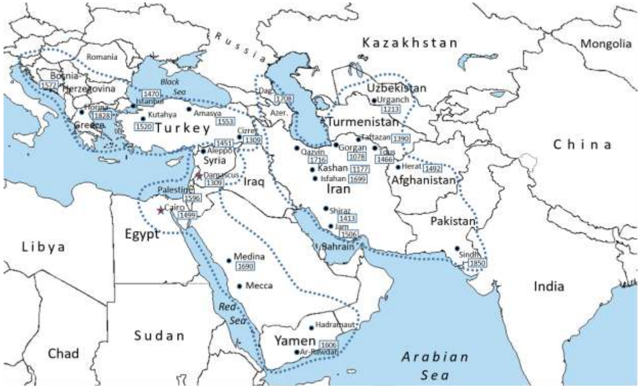
Rajah 2: Peta penyebaran karya al-cAwamil al-Mi'ah antara abad ke 6H/12M sehingga abad ke 14H/20M